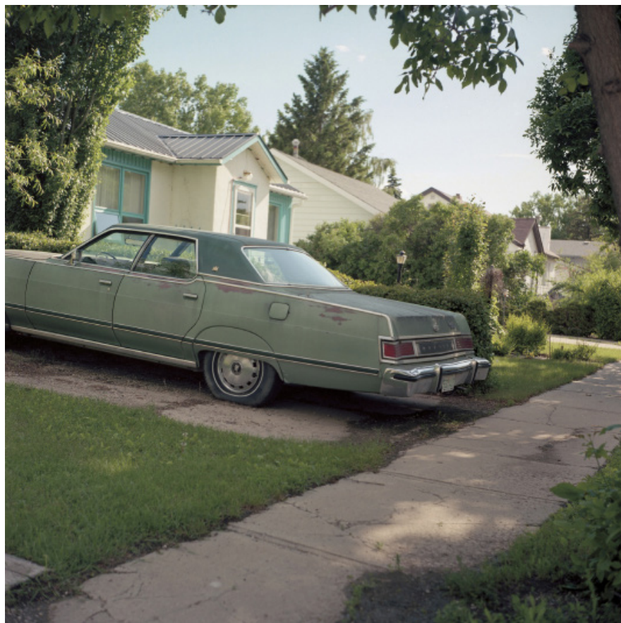
Populatie 477 uit de serie 'Out West'

Misschien moet je enkele kilometers verderop gaan staan, of misschien hoeft je slechts een stapje naar links of naar rechts te doen, want als je plekken fotografeert, heeft de positie van je lichaam een enorme invloed op de betekenis . Dat is de reden waarom alle fotografen in dit boek extreem kieskeurig zijn over de plek waar ze staan. Wil jij net zulke mooie foto's maken als zij, dan moet je hetzelfde doen.