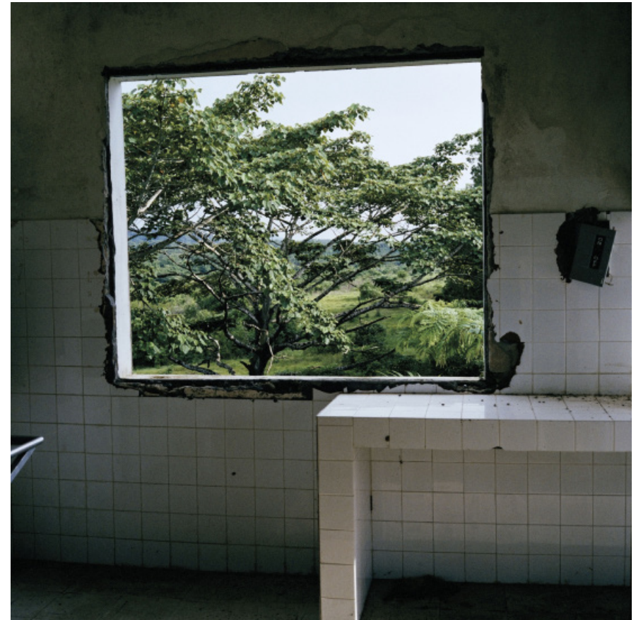
Tubmanburg, Liberia Tim Hetherington 2003

Is het niet fantastisch hoeveel je kunt zeggen met zo'n eenvoudige compositietechniek?